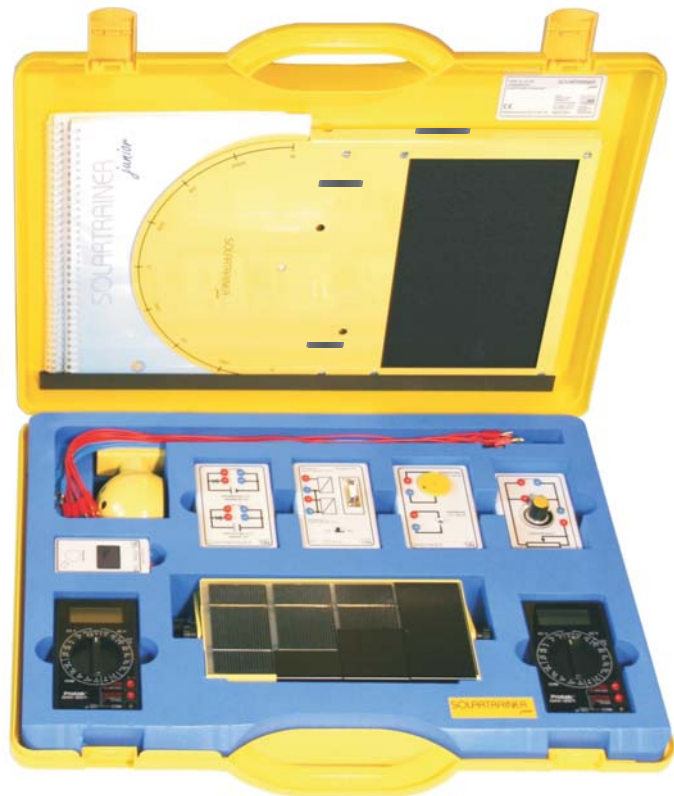
Abbildung mit Erweiterungspaket

Gefördert mit Mitteln des Bundesministers für Forschung und Technologie unter dem Förderkennzeichen 0329841C